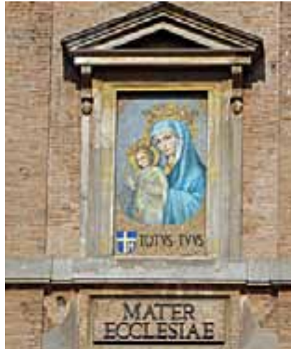
Das Bildnis Mariens, der „Mater Ecclesiae“, das Papst Johannes Paul II. am apostolischen Palast über dem Petersplatz hat anbringen lassen.

dass dieser Titel den Eindruck erwecken könnte, Maria würde außerhalb der Kirche stehen; andere wiesen darauf hin, dass dieser Titel keine Wurzeln in der Tradition der Kirche habe; wieder andere machten sich Sorgen über die Auswirkung auf den ökumenischen Dialog. Trotz der Ablehnung seitens des Konzils war Paul VI. überzeugt das Richtige zu tun und kündigte bei der Audienz am 18. November seine Entscheidung an, den Marientitel „Mater Ecclesiae“ bei der Schließung der dritten Konzilsperiode offiziell erklären zu wollen. Es sei bemerkt, dass diese Entscheidung