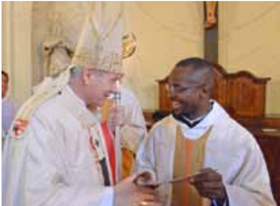
Kardinal Schönborn gratuliert dem Neupriester nach der Weiheliturgie

Nach dem Gottesdienst, bei dem auch ein afrikanischer Chor mitgesungen hat, wurde unser Neupriester von einer Gruppe