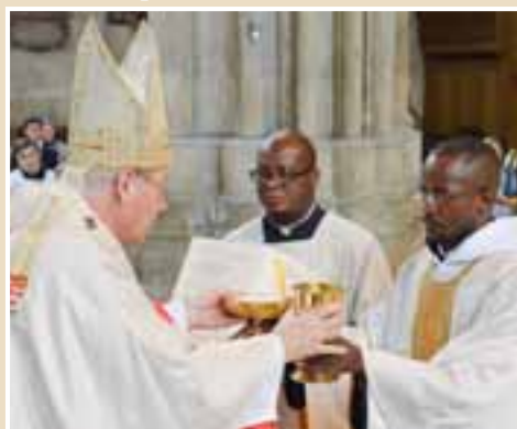
Der Kardinal übergibt dem Neugeweihten Hostienschale und Kelch.