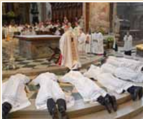
Während der Allerheiligenlitanei liegen die Weiehekandidaten auf dem Boden.