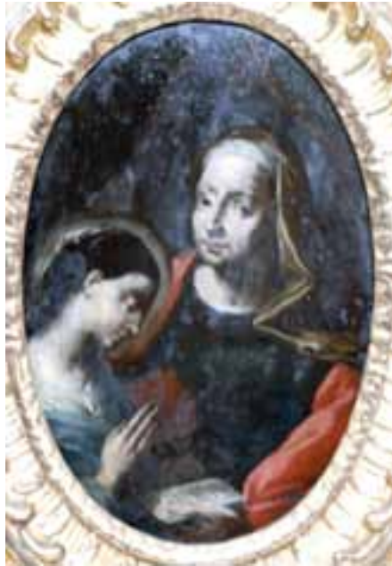
Mutter Anna lehrt Maria die heiligen Schriften des Alten Bundes

Liebe Leserinnen und Leser, der Frage nachgehend: „Wie kann man den Lebens- und Leidensweg Mariens feiern?“, begegneten uns viele Aspekte, die sich auch in unserem Lebens- und Arbeitsalltag widerspiegeln. Vielleicht ist spürbar geworden, wie sehr gerade Maria als Schmerzensmutter uns nahe ist. Maria,