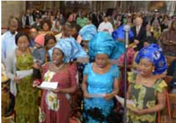
Ein afrikanischer Chor hat den Gottesdienst mitgestaltet.